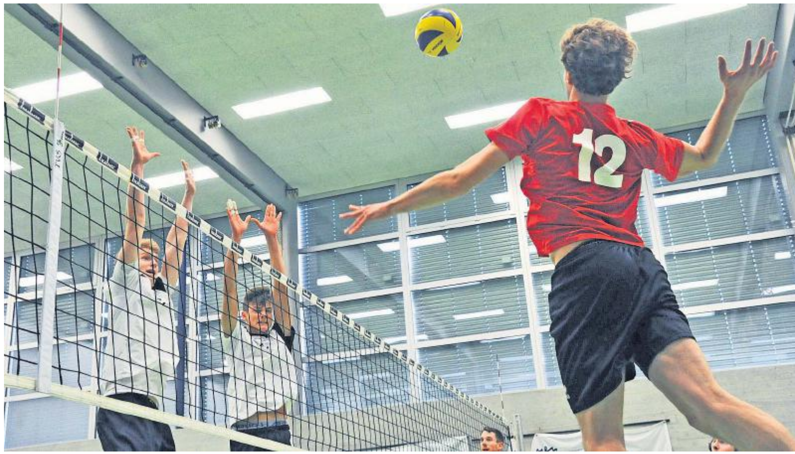
Der Berner Wenger versucht, am Schönenwerder Doppelblock vorbei zu punkten.